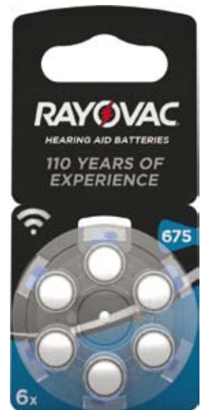
Artikel Nummer 0710010