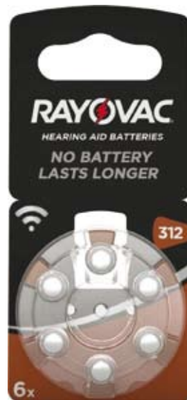
Artikel Nummer 0710012