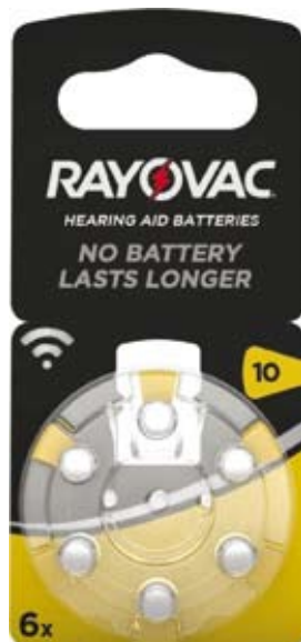
Artikel Nummer 0710013

Qualitäts-Hörgerätebatterien Speziell entwickelt für die neuesten Hochleistungsgeräte Umweltschonendes „Eco-Conscious Manufacturing“ Quecksilberfreie Anode, organische Elektrolyte und recycelbare Verpackungen