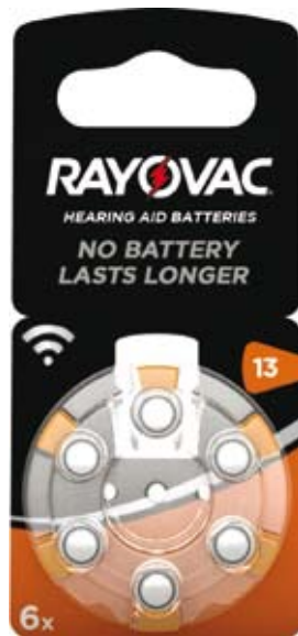
Artikel Nummer 0710011